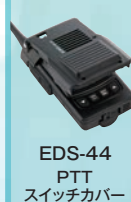
EDS-44 PTT スイッチカバー