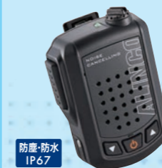
EMS-87BNC 防水ノイズキャンセル ワイヤレススピーカーマイク