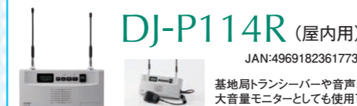
DJ-P114R (屋内用) JAN:4969182361773