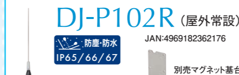
DJ-P102R (屋外常設) JAN:4969182362176