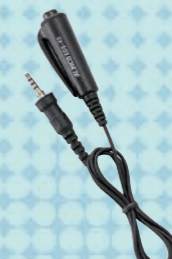
EDS-45 送信ボタン(スティック)