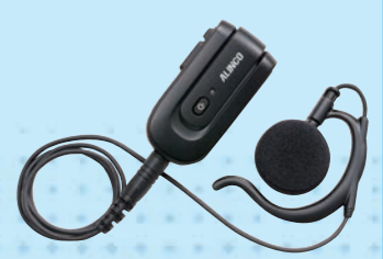
EME-80BMA ワイヤレスイヤホン (※IP67仕様ではありません。)