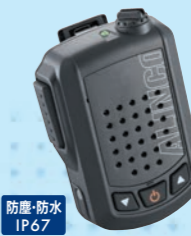
EMS-87B 防水ワイヤレススピーカーマイク