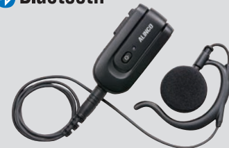
ワイヤレスイヤホンマイク EME-80BMA