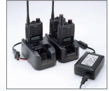
工具不要で最多4台のEDC-167RとEDC-162 ACアダプター1台を組み合わせ、8台同時に充電できるマルチチャージャーが作れます。