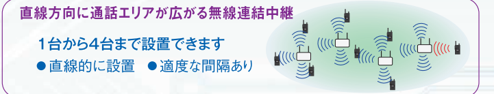
直線方向に通話エリアが広がる無線連結中継