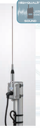
パイプ、バンド材は含まれません。