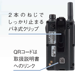
2本のねじでしっかり止まるバネ式クリップ