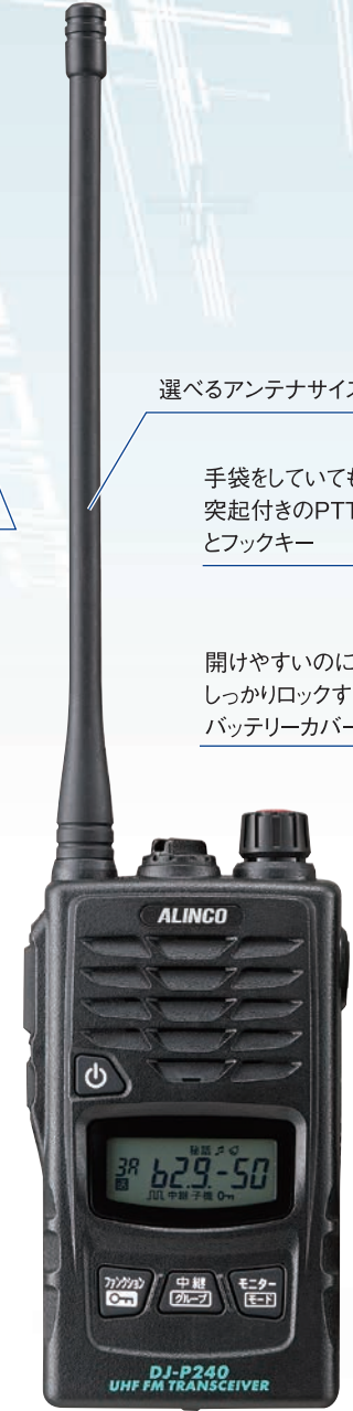
選べるアンテナサイズ