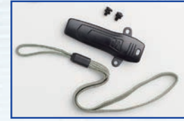
アクセサリを使わないときに防水してくれるねじ込み式のジャックカバー