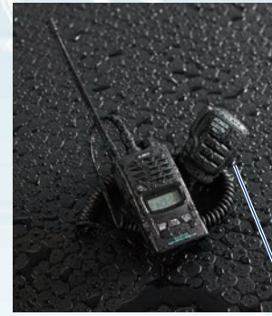
マイクユニットもIP67の耐塵防浸、別売スピーカーマイク、EMS-71