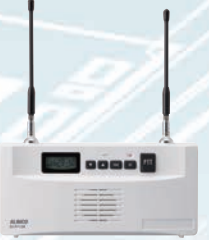
オープン価格 JANコード: 4969182361759