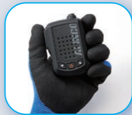
ワイヤレススピーカーマイクは大音量、騒音下でもよく聞こえます。