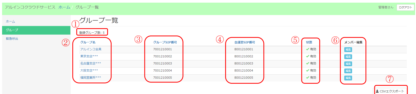
図 3-2 グループ一覧画面の例

※グループは申込書の内容に沿って出荷時に登録済みです。グループの追加・新規作成については項 6 (P. 10) に記載の連絡先にお問い合わせください。