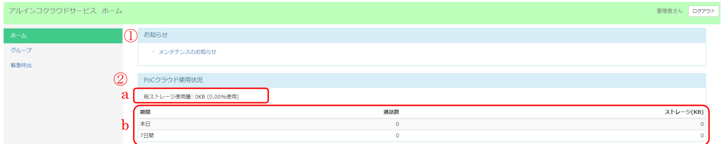
図 3-1 ホーム画面の例

ホーム画面ではシステム管理者からのお知らせとクラウドの使用状況の情報が表示されます。