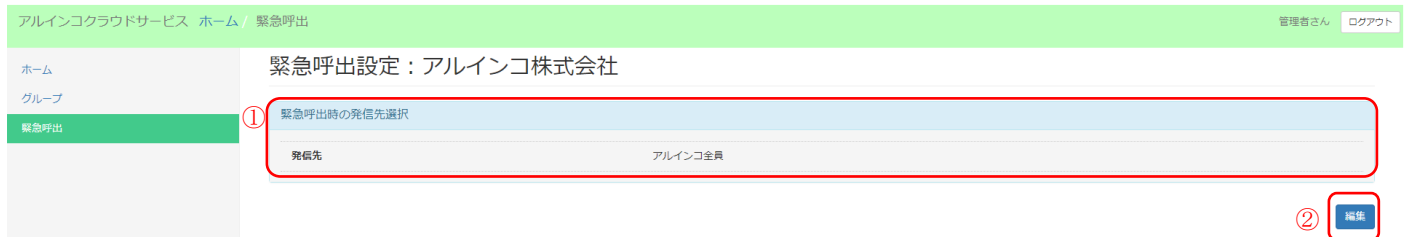
図 3-7 緊急呼出設定画面の例

緊急呼出では IP 無線機で使われる機能「緊急呼出」時の呼出相手（グループ）を編集できます。